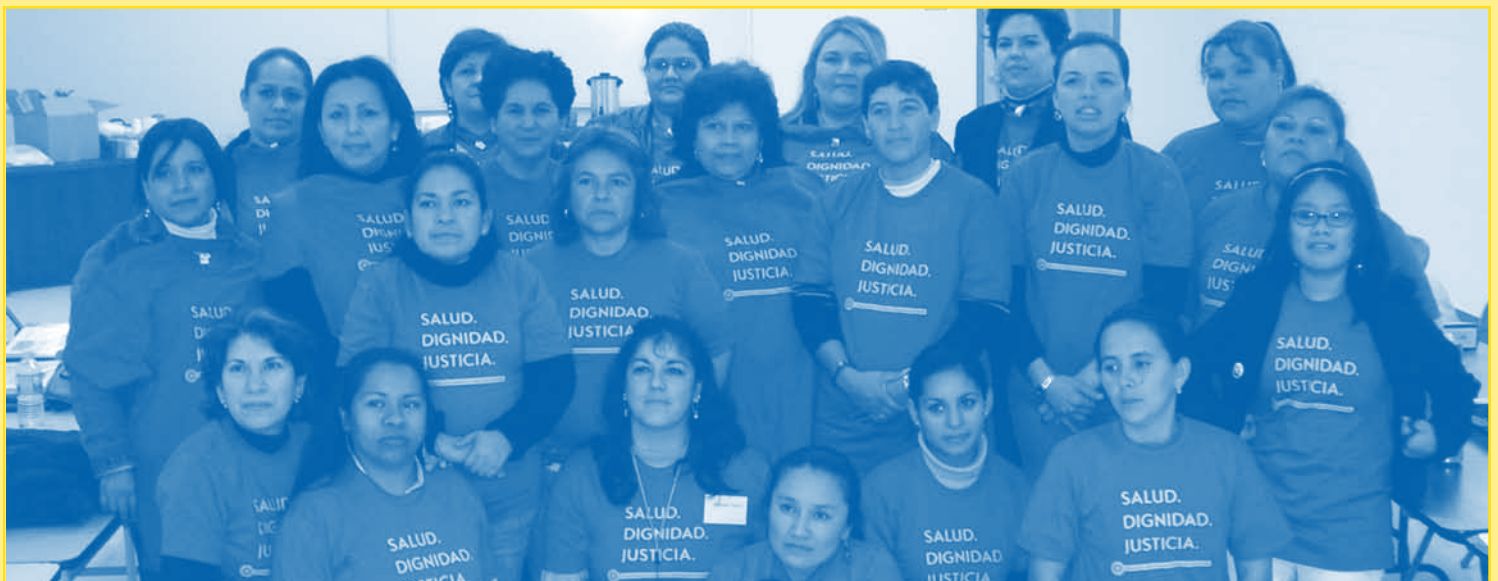
El Valle del Río Grande, TX, graduadas LOLA, febrero 2007 • The Rio Grande Valley, TX, LOLA graduates, February 2007

Si desea saber más sobre nuestros Programas de Movilización Comunitaria, por favor visite www.latinainstitute.org . ○