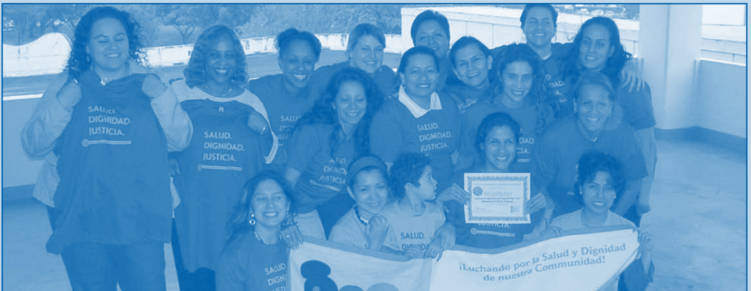
Miami, FL, LOLA graduates, April 2007 • Miami, FL graduadas de LOLA, abril 2007

If you would like to learn more about our Community Mobilization Programs, please visit www.latinainstitute.org . ●